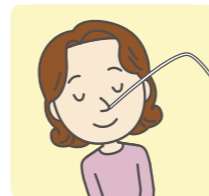
痰吸引(かくたんきゅういん)