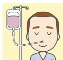
経管栄養 (経鼻・胃ろう)